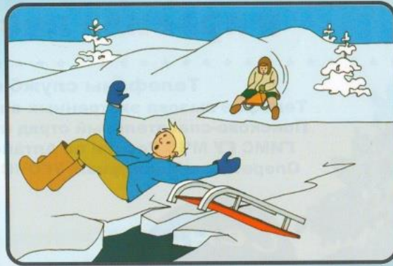
Под снегом могут быть трещины и разломы.