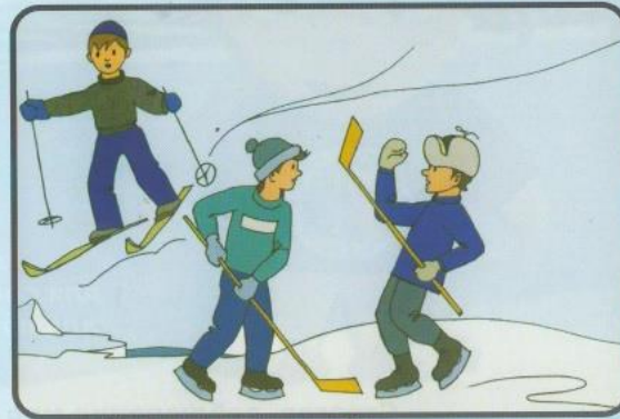
Под снегом могут быть полыньи, трещины или лунки.