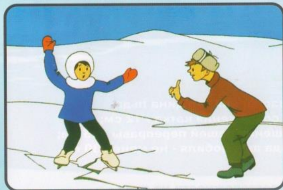
Если под вами затрещал лёд, ложитесь, и плавно перекатывайтесь в безопасное место.